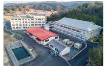
社員施設 世羅エデュケーションパーク (広島県世羅郡世羅町)