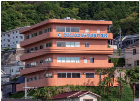
学校法人ダイキ学園 ウェルテック専門学校 広島校 (広島県広島市)