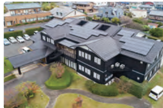
有限会社 D-CLIP 介護保険サービス事業所 (岐阜県海津市)

《高齢者福祉》 ●香和ショートステイ ●かぐわがアサヒセンター ●リハビリデイ香和