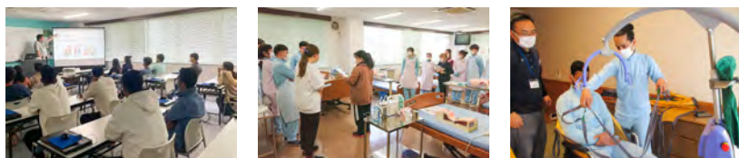
●画像は「介護福祉士実務者研修」開校前の為、本校介護福祉学科の授業・研修写真をイメージとして使用。