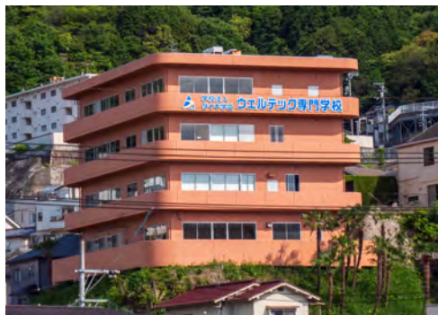
学校法人ダイキ学園 ウェルテック専門学校 広島校

グループ会社 株式会社ダイキ、株式会社ダイキエンジニアリング、株式会社プロスタイル、グローバルコミュニケーション協同組合、NPO法人 World Big Bonds、社会福祉法人 八丁堀福祉会、 学校法人ダイキ学園 ウェルテック専門学校 広島校 Daiki Lanka, ProStyle Lanka 関連施設 日本語学校運営、企業主導型保育園運営、就労支援施設/福祉施設運営、トヨタ自動車(株)、デンソーテクノ(株)、三菱重工業(株)、川崎重工業(株)、日本電気/NEC(株)、富士通/Fujitsu(株)、IHI、JMU、マツダ(株)、富士重工(株)、(株)日立製作所、東芝G、ソニーG 他