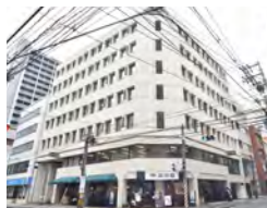
社会福祉法人 八丁堀福祉会