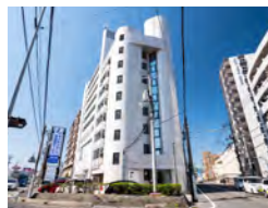
総合福祉サービス 古の市